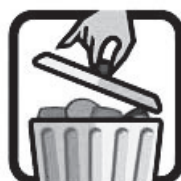
MANTENHA A LIXEIRA FECHADA