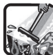
NÃO DEIXE ÁGUA ACUMULADA SOBRE A LAJE