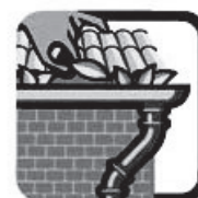
MANTENHA AS CALHAS LIMPAS

E não se esqueça: se sentir febre com dor de cabeça, dor atrás dos olhos, no corpo e nas juntas, pode ser dengue. Procure uma unidade de saúde.