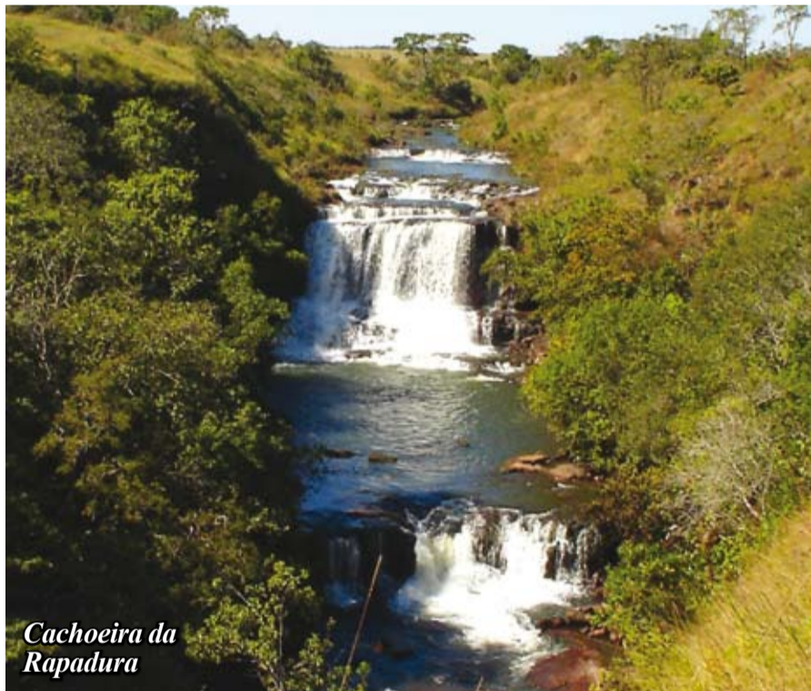
Cachoeira da Rapadura