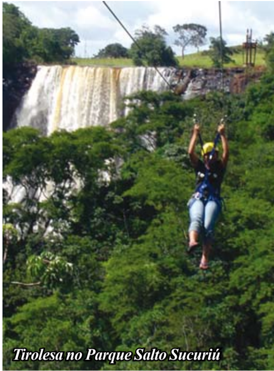
Tirolesa no Parque Salto Sucuriú