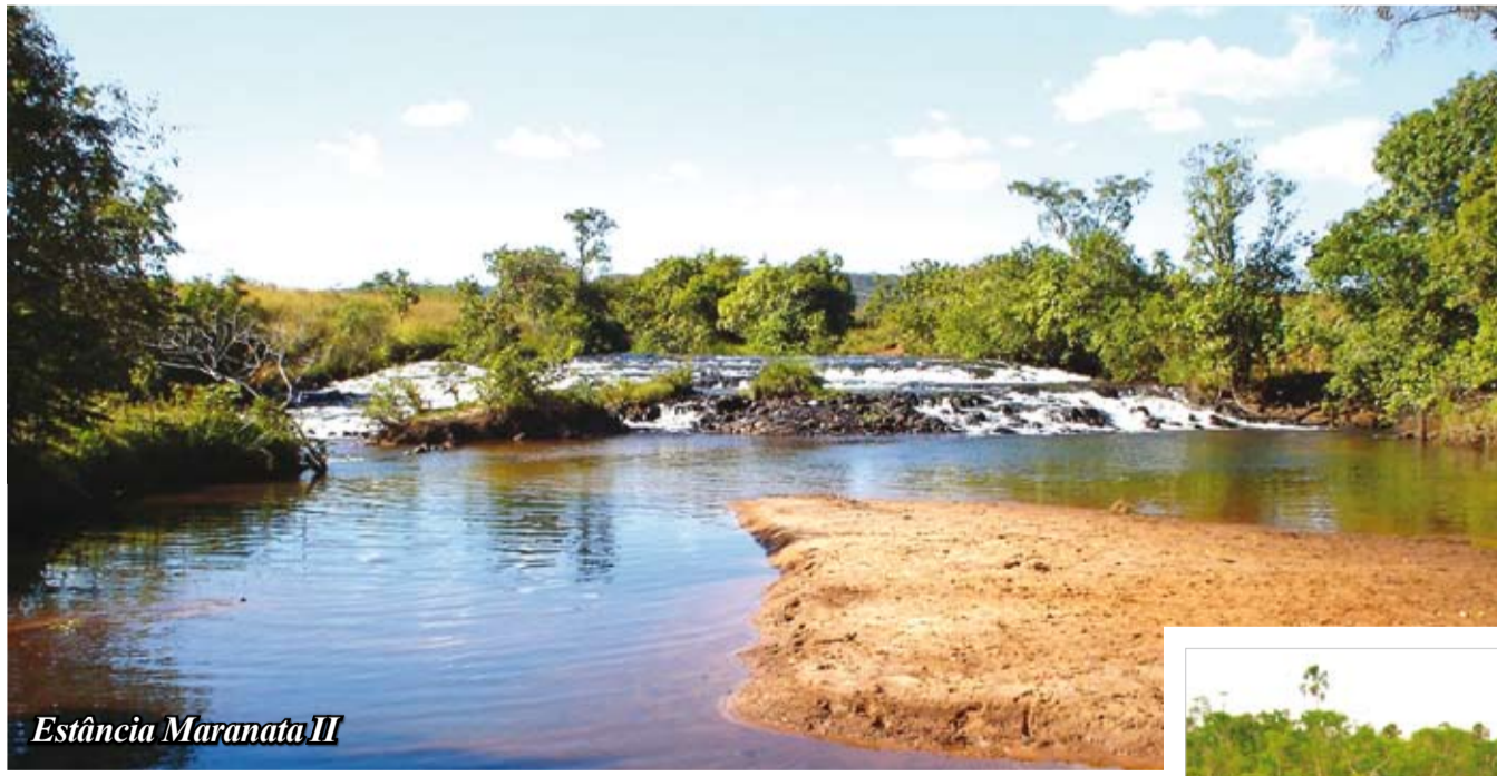
Estância Maranata II