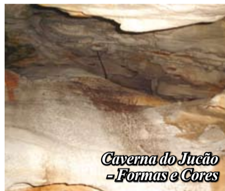
Caverna do Jucão - Formas e Cores