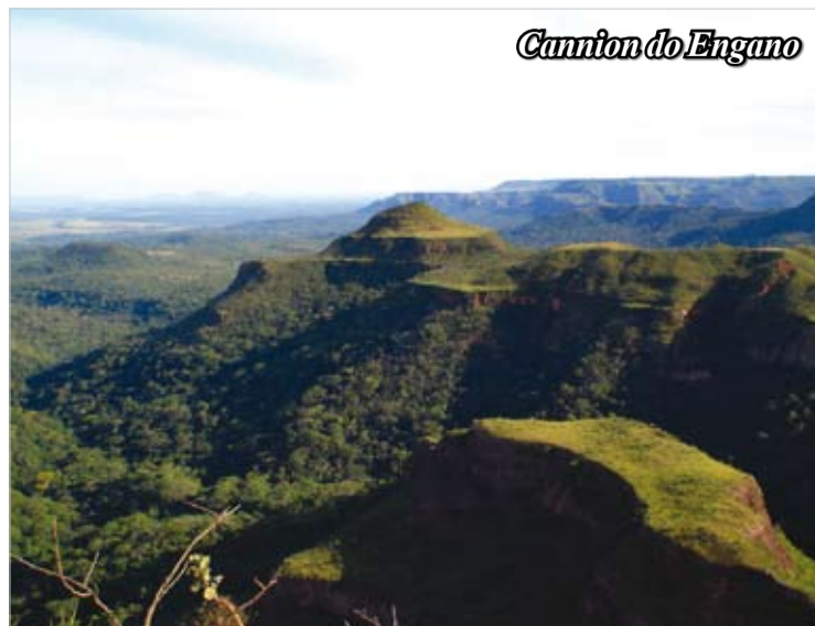
Cannion do Engano