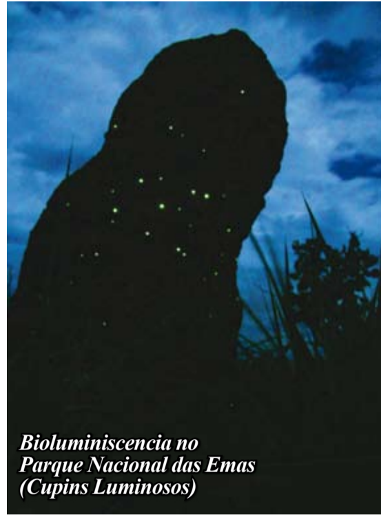
Bioluminiscencia no Parque Nacional das Emas (Cupins Luminosos)