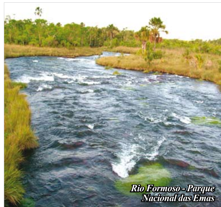
Rio Formoso - Parque Nacional das Emas