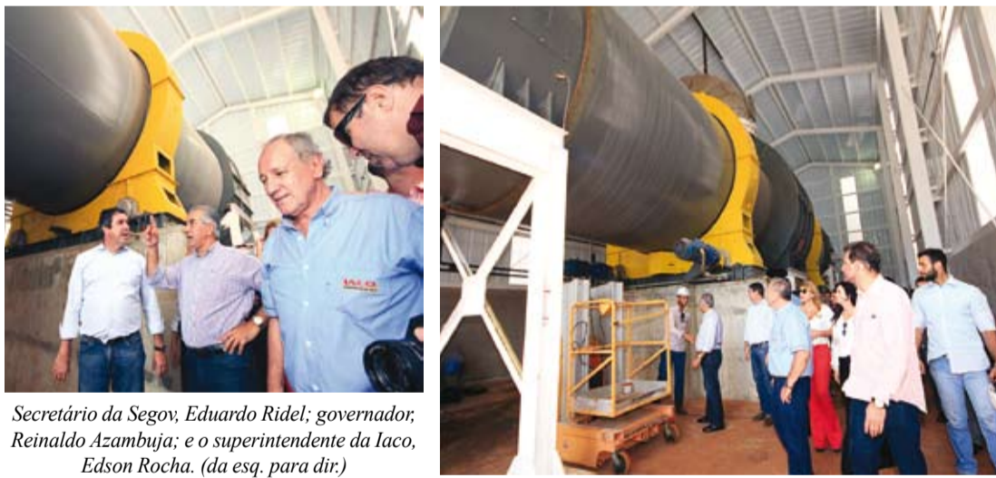
Secretário da Segov, Eduardo Ridel; governador, Reinaldo Azambuja; e o superintendente da Iaco, Edson Rocha. (da esq. para dir.)

O governador de Mato Grosso do Sul, Reinaldo Azambuja (PSDB) participou na terça-feira, 09 de maio de 2017, da inauguração da unidade de produção de açúcar mascavo (VPH) da Usina "Iaco Agrícola S/A" de Chapadão do Sul. Com injeção de R$ 83 milhões na economia da região, a empresa ampliou sua planta industrial e gerou 560 novos empregos. Durante o evento, Reinaldo Azambuja lembrou que a criação da planta de açúcar nasceu de um desafio feito por ele aos empresários e acabou desafiado em troca de nova ampliação da unidade.