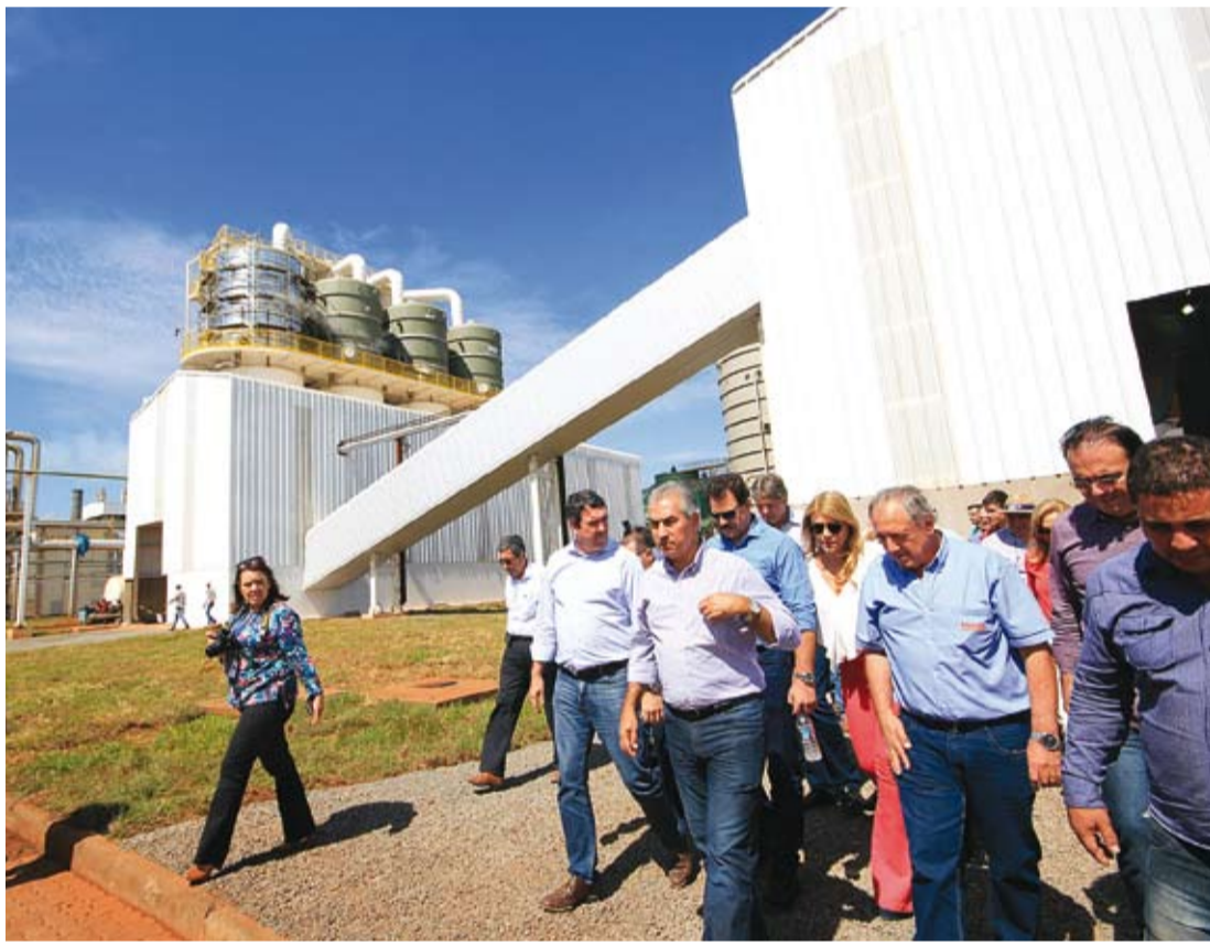
Construção do setor de açúcar avaliado em R$ 83 milhões nasceu de um desafio feito pelo governador; agora aposta parte do outro lado.