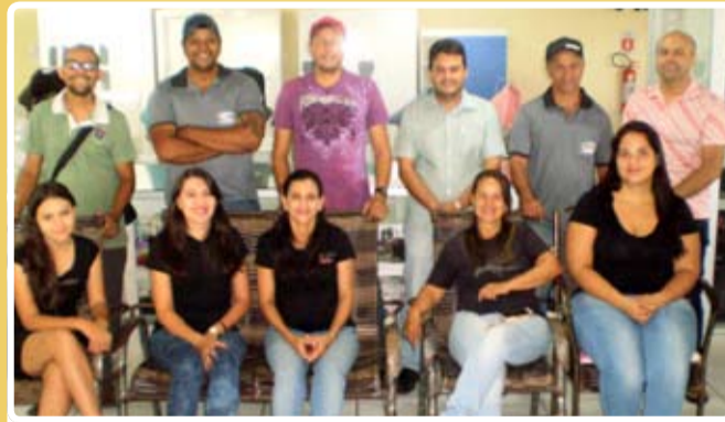
Equipe de funcionários da FRILAR