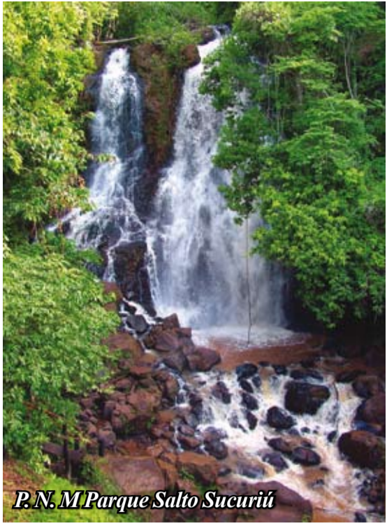
P.N.M Parque Salto Sucuriú