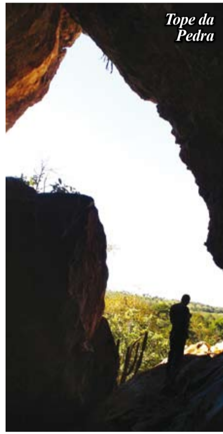
Tope da Pedra