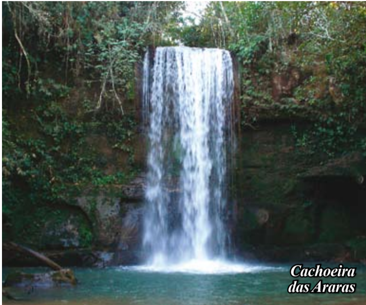
Cachoeira das Araras