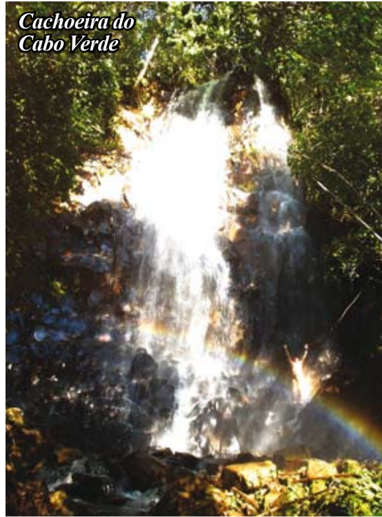
Cachoeira do Cabo Verde