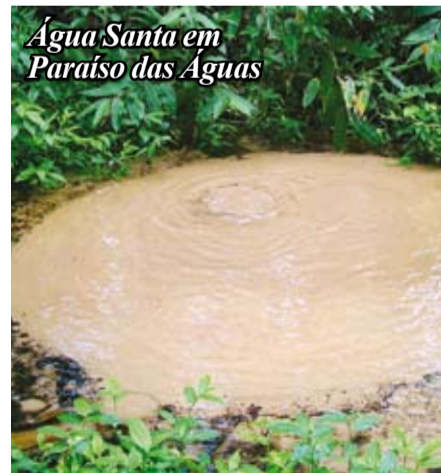
Água Santa em Paraíso das Águas