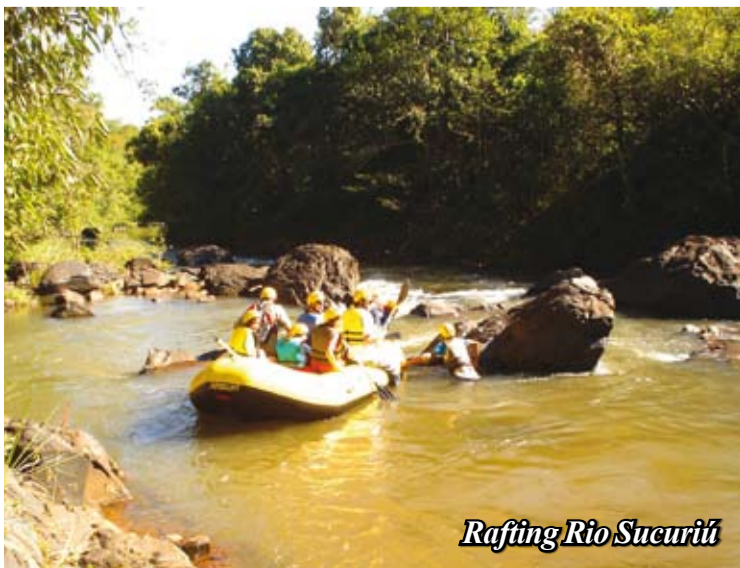
Rafting Rio Sucuriú