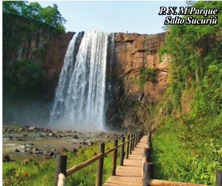
P.N.M Parque Salto Sucuriú