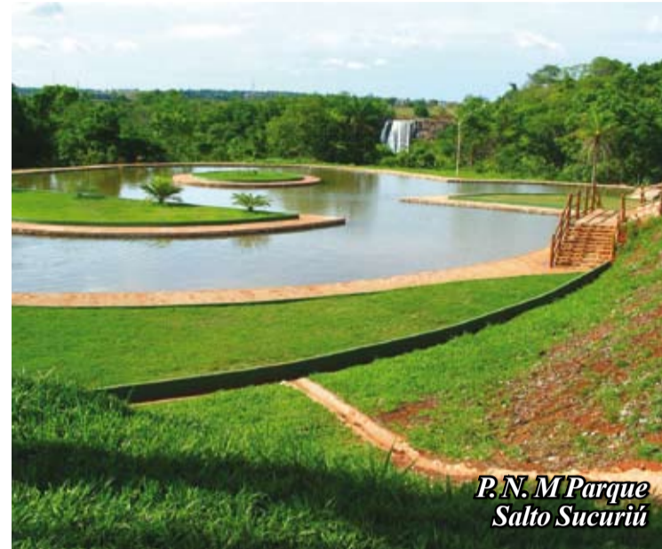
P.N.M Parque Salto Sucuriú