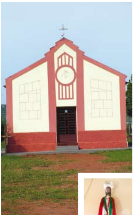
Capela do Santo Fúfio (Senhor Bom Jesus da Capela)