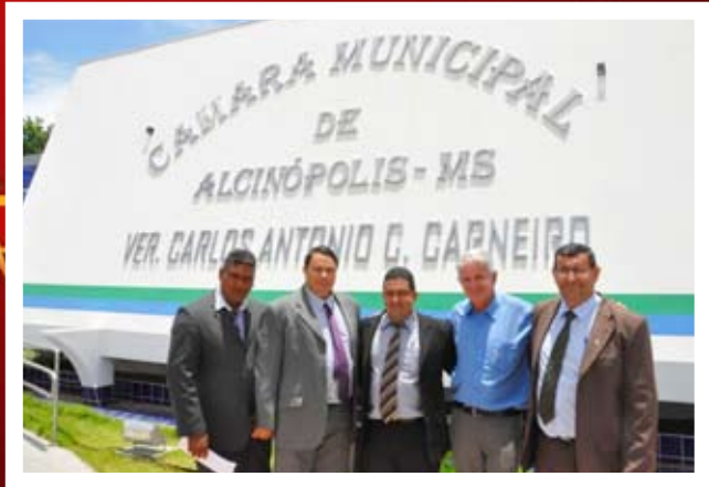
Nova Mesa Diretora da Câmara de Vereadores de Alcinópolis

Feliz Natal e um próspero Ano Novo! CÂMARA DE ALCINÓPOLIS