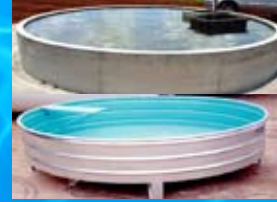
Bebedouros de concreto armado e chapa