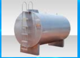
Tanque para combustível