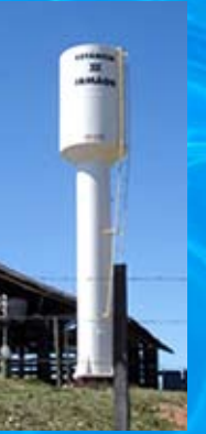
Caixa d'água tipo taça e tubular

Alternando euforia com reflexão vamos virando a página de mais um ano. Nossas metas foram cumpridas. É hora de cantarmos juntos, um hino de louvor pelas bênçãos recebidas.