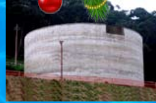
Reservatório de concreto